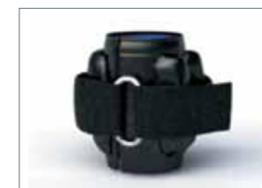
Манжеты для ног