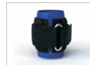
Манжеты для рук

Применяются во всех видах спорта. Для игровых видов спорта предназначены ручные манжеты весом 0,4 кг, 1 кг и 1,6 кг. Свыше 2,5 кг рекомендуется использовать при нерезких движениях (бег, упражнения). Производится более 12 моделей весом от 0,4 до 8 кг. ■