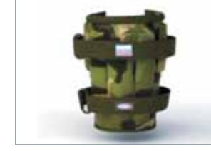
Манжеты для рук

Мы не ставим своей целью производить много. Наше производство – это квалифицированный ручной труд направленный на выполнение заказа для конкретного вида спорта с учетом специфики подготовки спортсменов. Все изделия запатентованы и имеют гигиенический сертификат.