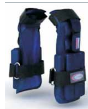
Перчатки для боя с тенью «Кобра»

в зависимости от веса и физической подготовки боксера. Интенсивные тренировки в перчатках заканчиваются за пару дней до соревнований. Так же изготавливаются модели весом 7,5 и 11,5 кг на каждую руку.