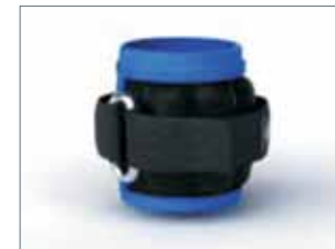
Манжеты для ног

Применяются во всех видах спорта. Манжеты весом до 2 кг используются для скоростной работы – бег, игра. Манжеты весом свыше 2 кг рекомендуются использовать для физических упражнений (махи, прокачка). Изготавливается более 15 видов манжет для голени весом от 0,5 до 12 кг.