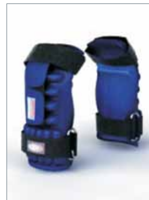
Перчатки для боя с тенью «Кобра»

Само название говорит за себя. Перчатки были разработаны в 2001 году на базе сборной команды России по боксу, где, с небольшими усовершенствованиями, применяются и по сей день. Для боя с тенью в основном используются «Скат» 1.8 кг и «Кобра» 3,5 кг,