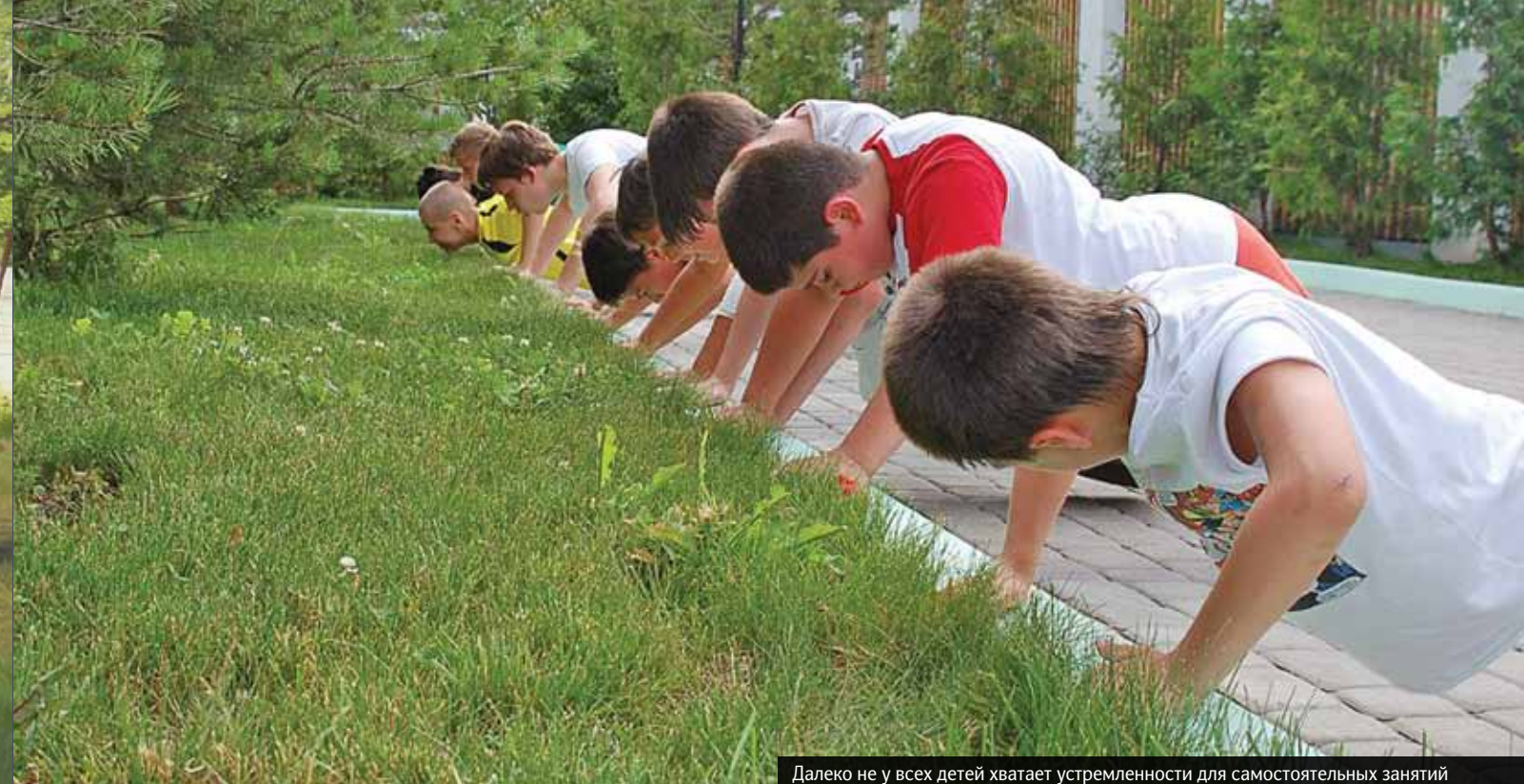
Далеко не у всех детей хватает устремленности для самостоятельных занятий